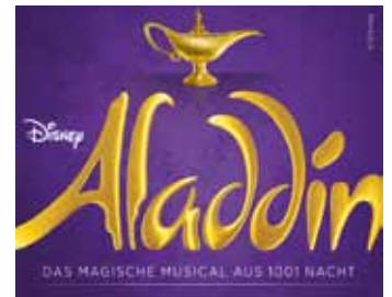
Alle Coverbilder von © Stage Entertainment GmbH