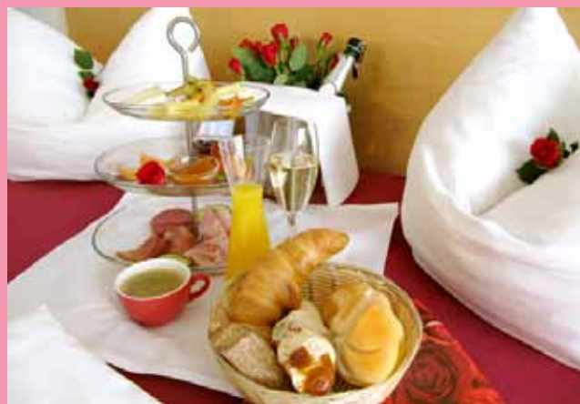
Romantische Tage auf der herrlichen Schwäbischen Alb