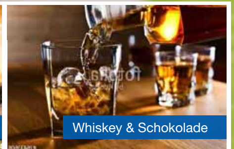
Whiskey & Schokolade